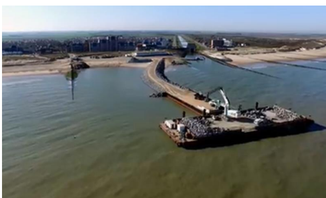
Locatie van de aanlandingen en een voorbeeld van een aanlanding bij Cadzand

Begin november starten we met de bouw van de eerste aanlanding iets ten noorden van het gemaal Dijkmanshuizen. We richten op deze plek een loslocatie in, welke is opgebouwd uit breuksteen en grond.